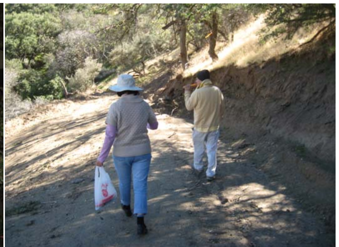
Cảnh Đạo Viện vừa sau cơn mưa.