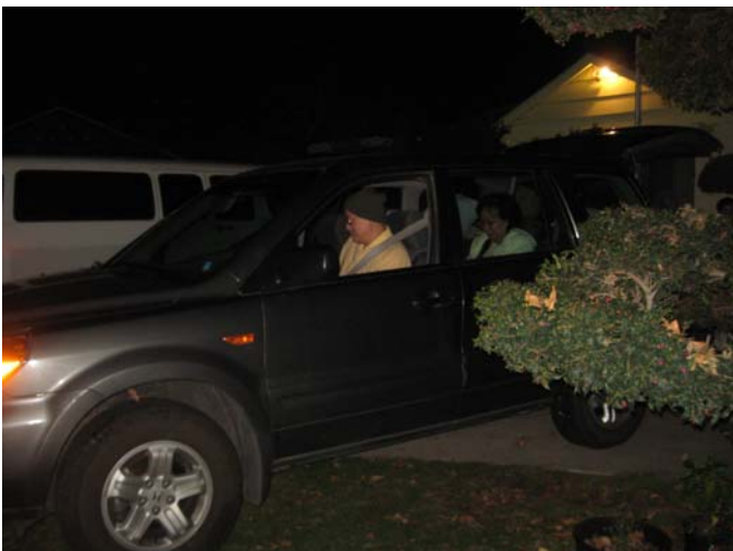
Thầy lên đường đi Đạo Viện.