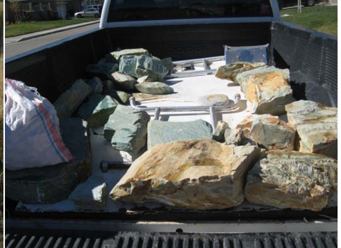
Khoảng 1 tấn đá quý được chở từ Đạo Viện về ĐHLĐ.