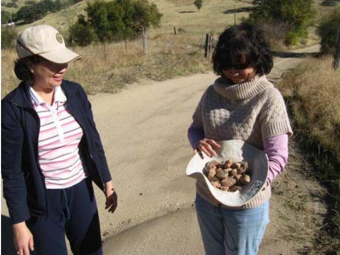
Các vị “thu hoạch” đá quý tại Đạo Viện.